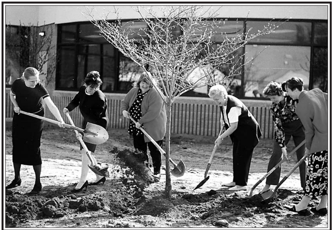
Plante árboles a modo de memoriales y regalos conmemorativos.