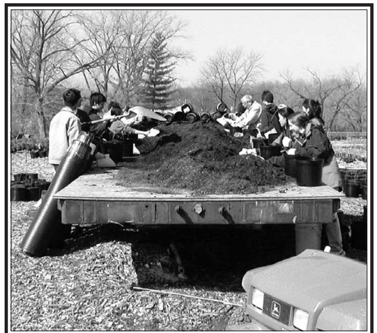
The National Tree Trust ayuda a financiar los viveros de árboles comunitarios.