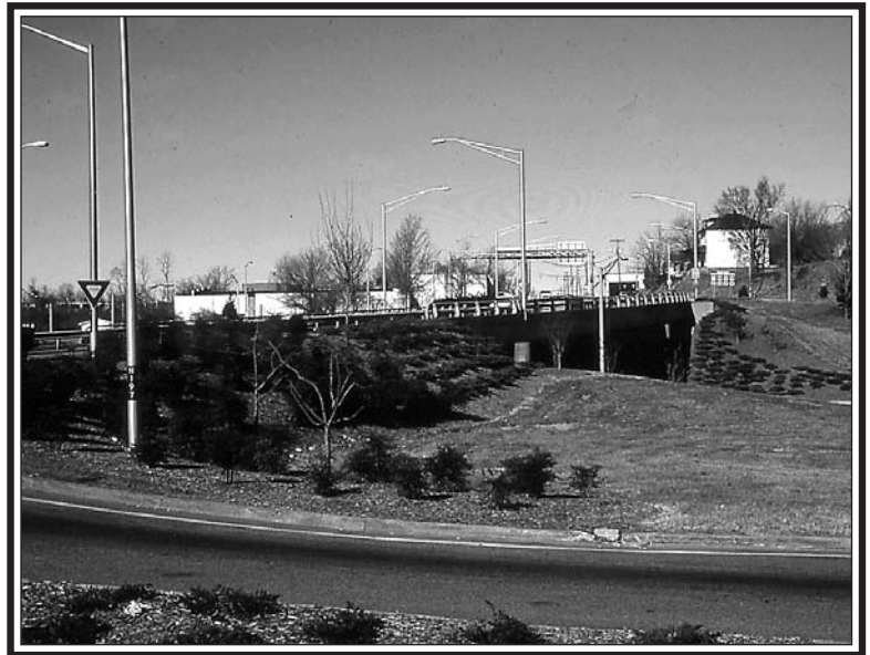
El U.S. Department of Transportation financia proyectos para ayudar a “preservar y crear comunidades más habitables.”

Un significativo financiamiento está disponible anualmente gracias al Transportation Equity Act de 1998 para ayudar a “preservar y crear comunidades más habitables donde las carreteras preserven y se fusionen con el medio ambiente natural, social y cultural”. Los fondos se han usado para plantar árboles a la entrada de las ciudades, en los cruces de carreteras, en senderos de bicicletas, en aeropuertos, en los lotes de estacionamiento y en otras locaciones relacionadas con las carreteras públicas y el tránsito. La manera en que el dinero se pone a disposición varía en cada estado. En algunos se hace a través del departamento estatal de carreteras. En otros, se entrega al coordinador de silvicultura urbana y comunitaria para que lo ponga a disposición más eficientemente junto con las otras subvenciones para la silvicultura. Contacte su departamento de carreteras para saber más sobre esta oportunidad en su estado.