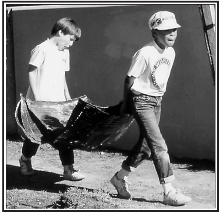
Al trabajar con niños, recuerde que ellos se desarrollan más con las actividades prácticas.

Si hay un trabajo que usted quiere realizar, hacerlo con grupos de escolares normalmente no es el mejor método. Si la educación es su misión, no hay mejor potencial para