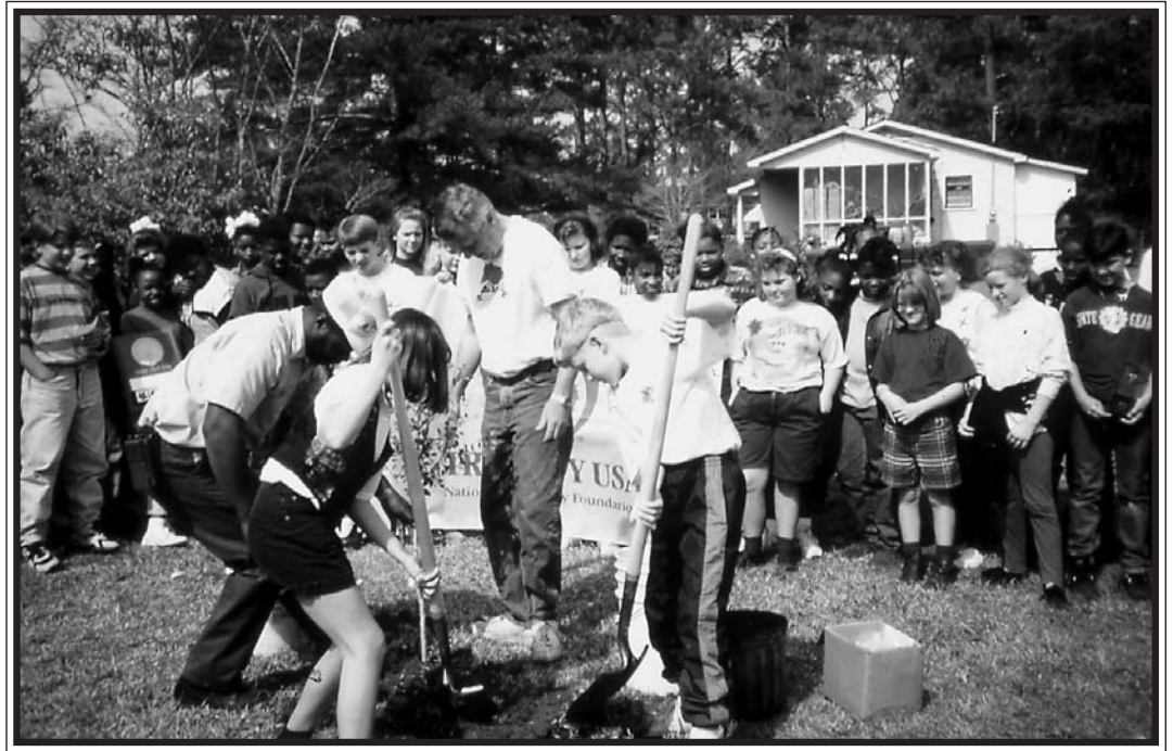
A algunos voluntarios les gusta trabajar con otros y formar nuevas amistades.